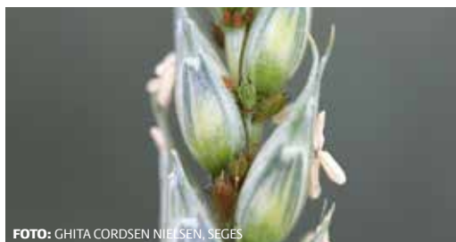
Bladlusene trivedes i den varme og tørre sommer. Her kornbladlus.

I tabel 32 ses resultaterne af 3 forsøg med bekæmpelse af bladlus om efteråret og bejdsning med Latitude mod goldfodsyge i tidligt sået hvede. Bladlus kan om efteråret overføre havrerødsotvirus. De tre forsøg er sået i perioden 5.-19. september, og forsøgene blev ikke sået så tidligt som tilstræbt. Forfrugten har været hvede.